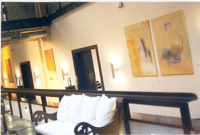
Gastwerk Hotel, Hamburg