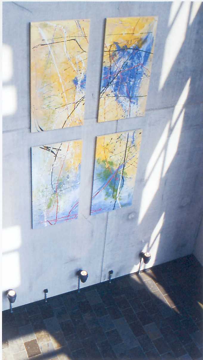
Bürohaus Otto von Bahrenpark