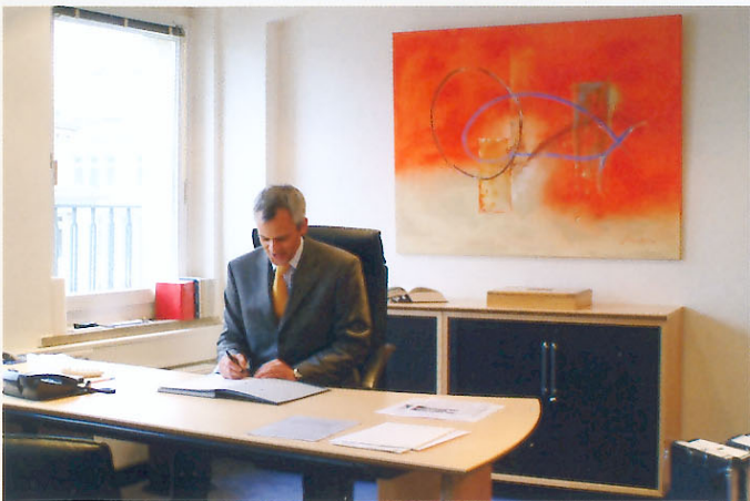
Kanzlei Happ Recke Luther