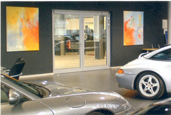
Porsche-Zentrum Hamburg Nord-West